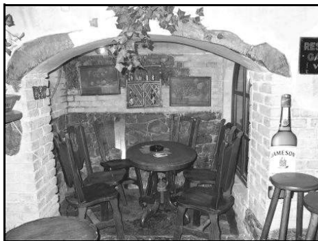
Interiér Velitelství DH

branná magie zasahující především Šero - obyčejným smrtelníkům není ve vstupu bráněno, takže není porušen žádný článek Dohody.